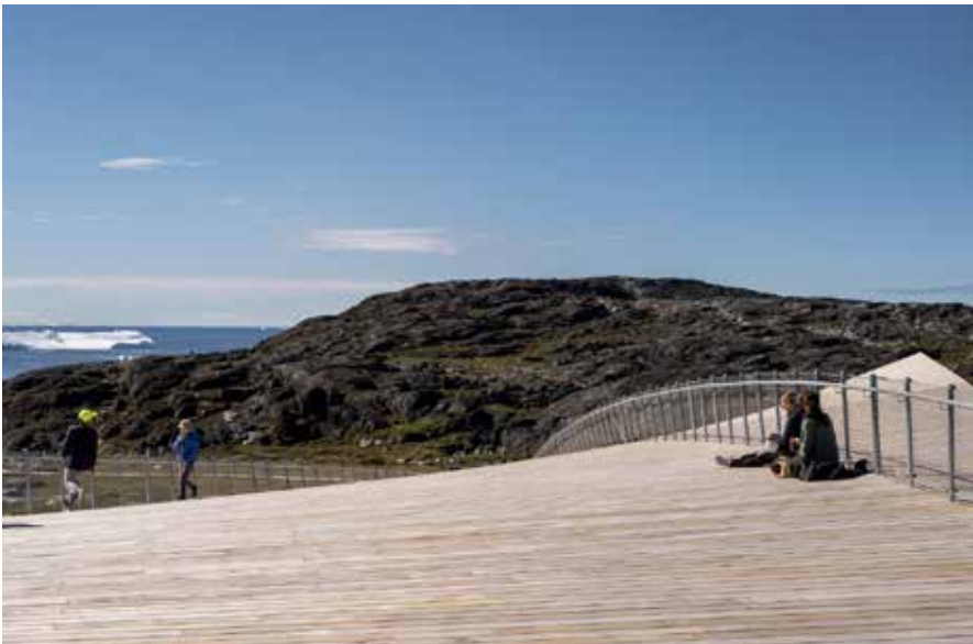
Illup sangujoraartumik sananeqarnerani takusaasut nutaanik isikkiveqalertarnissaat periarfissinneqarpoq.

Kangiata Illorsua sumiiffimmi pisuttarfinnut katersuuffittut inissisimavoq aammalu Ilulissat kangianut ataqatigiisillugu. Ilulissani illoqar-fimmiit takusaasut illorsuarmut apuunnerminni illu qaqqat akornanniittoq qisunnik sanaajusoq takussavaat. Tassanngaanniit salliarnartamut iseriartortarfianut qulisamut ingerlasinnaapput aammalu illorsuarmut ingerlaqqissinnaallutik imaluunniit qaavanukarsinnaallutik.