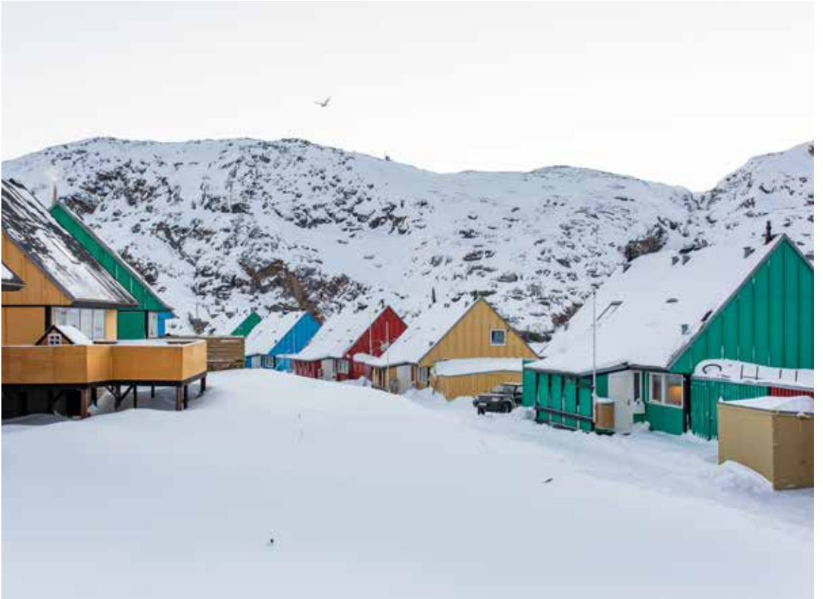
Illut qisunnik sanaat mikisut sakkortuumik qalipaaitillit Kalaallit Nunaanni illulioriaatsimut ilisarnaataapput.