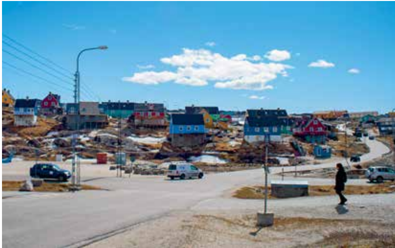
Ilulissani illoqarfimmi ulluinaat ilaat.

Tikeraarpassuaqalernissaa eqqarsaatigalugu misigisassarsiornerit Kalaallit Nunaata takornarianut neqerorutigisinnaasaasa pitsaanerulersineqarnissaat kissaatigineqarpoq. Taamaattumik Namminersorlutik Oqartussat ukiuni aggersuni takornarianut sullissivinnik katillugit arfinilinnik pilersitsiniarput, tassani Realdania siullermut, tassalu Ilulissani Kangiata Illorsuanut, pilersitsinermut tapersiivoq. Kalaallit Nunaat pillugu oqaluttuat ersarinnerulersinnissaasa saniatigut Kangiata Illorsua aammalu siunissami takornarianut sullissivissat aamma Kalaallit Nunaata aningaasaqarneranik pitsaasumik ineriartortitseqataassapput, taakkua naggataatigut sullivissanik amerlanerusunik aammalu inuiaqatigiinni kalaallini siuariartortitsinerulernermik qulakkeereqataassallutik.