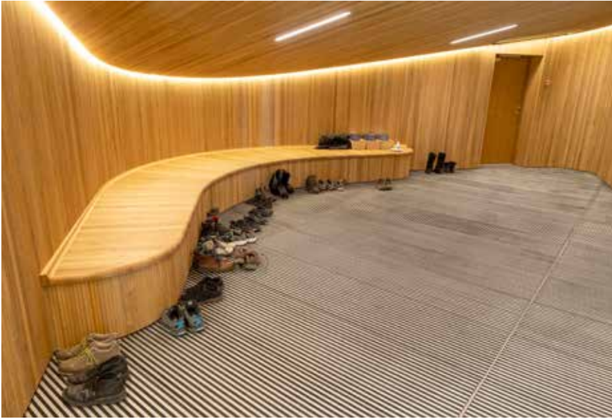
Kangiata Illorsuata iluani iikkat qisunnik immikkut ilusilersugaasunik listilersugaapput.

Silap pissusaata allanngoriartornerata, taassumalu Issittumi ineriartornerata nunarsuup sinneranut pingaaruteqarnera, Kangiata Illorsualiornermi ukkatarinnarneqassaaq. Silap pissusaata allanngoriartornerata malitsigisaanik Kalaallit Nunaanni sermersuup aakkiartornerulernera, nunarsuarmi immap qaffakkiartorneranut pisutaasartut tamarmiusut pingajorarterutaasa missaanniippoq.