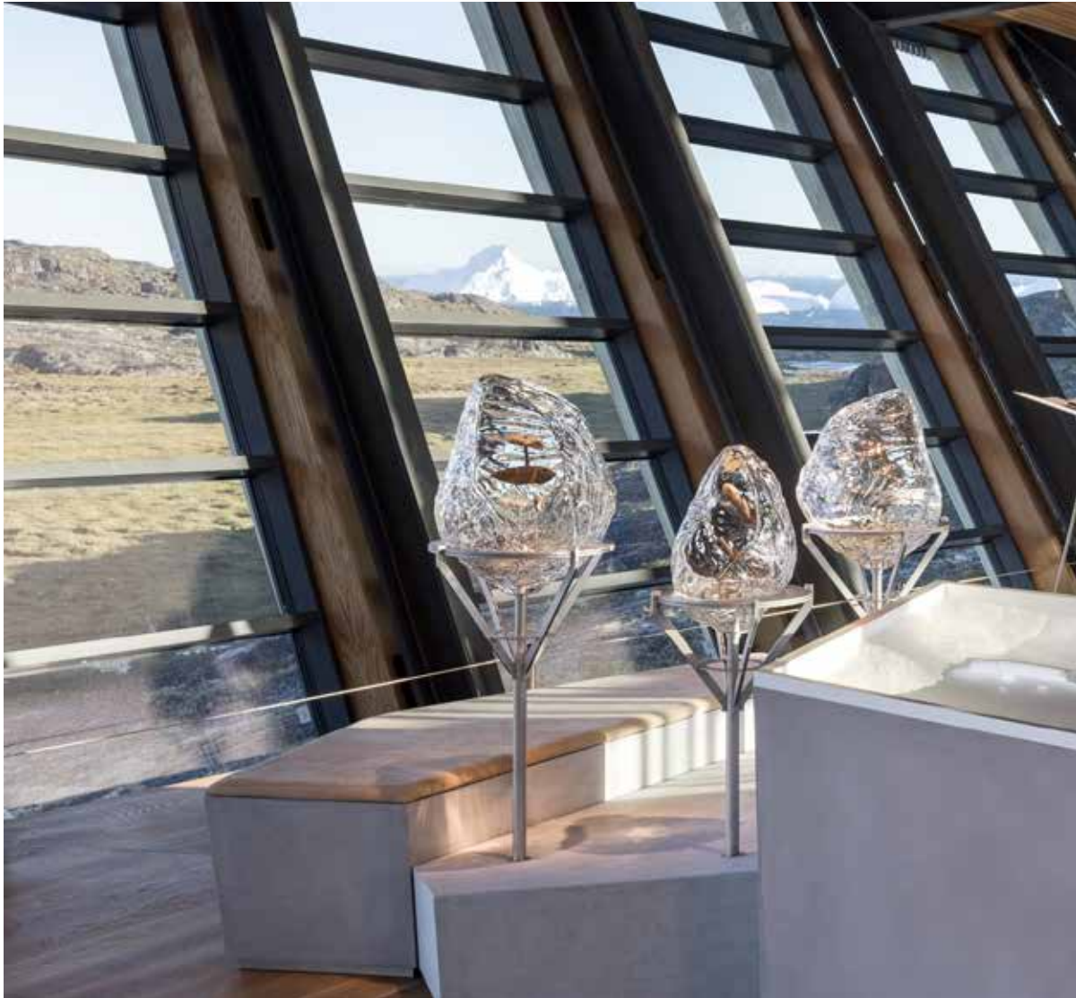
Saqqummersitsivimmiittut sikutatut ilusiligaapput, tassaniillutik itsarsuarnitsat aammalu filmiliat prismeni sermitut ilusiligaasuni igalaaminernik supoorlugit sanaajusuni saqqummersinneqartut