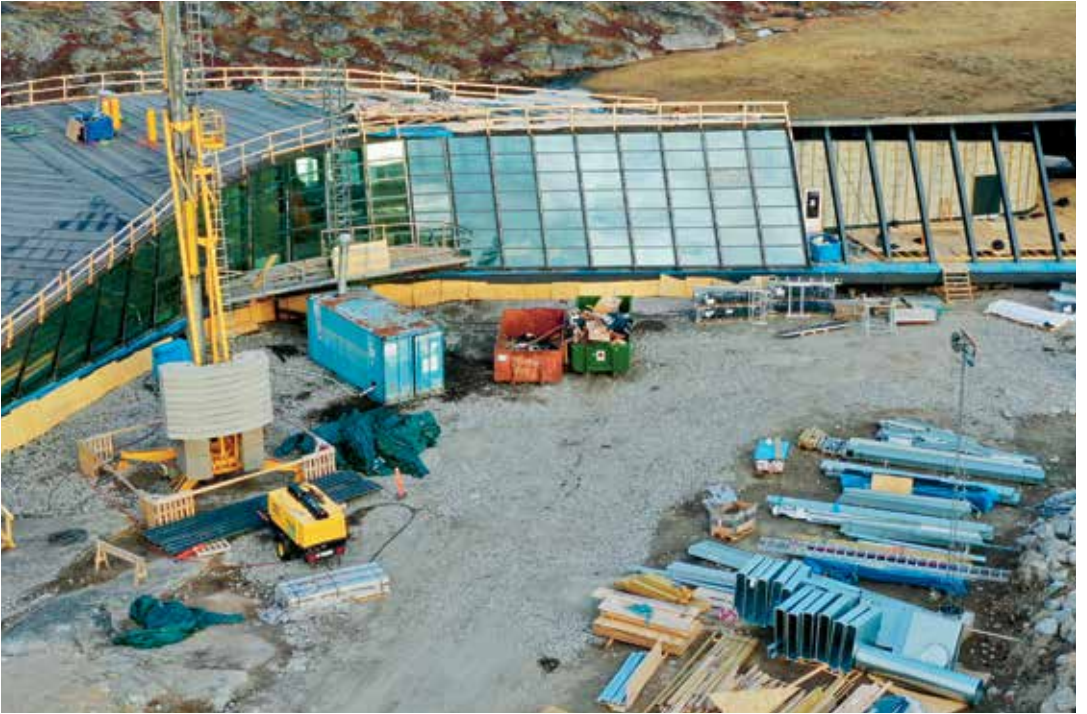
Igalaat 300-t assigiinngitsunik angissusillit illumi ikkussorneqarput.