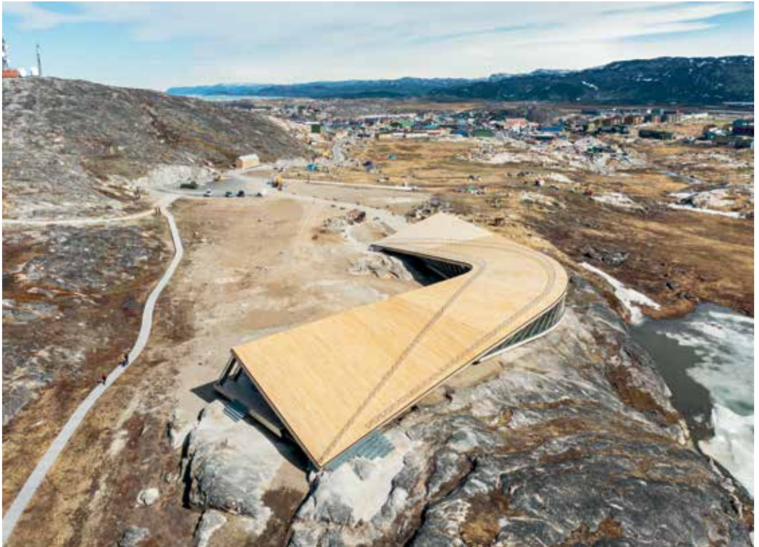
Kangiata Illorsua uppiup timmisup isikkivianit isigalugu.