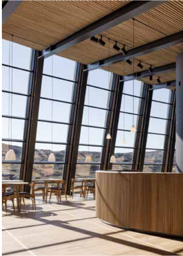
Saaffiginnittarfimmiit pinngortitamut toqqaannartumik isikkivia.