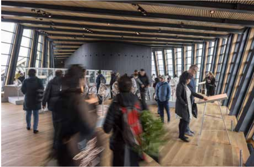
Takusaasut saqqummersitsineq Sermeq pillugu Oqaluttuaq misigisaqarfigaat.