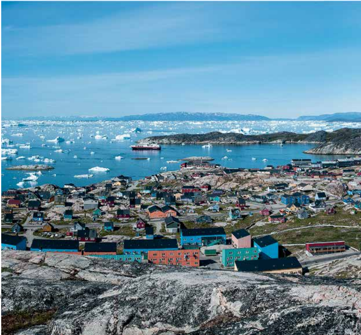
Ilulissat illoqarinnut kanatannut isikkut.