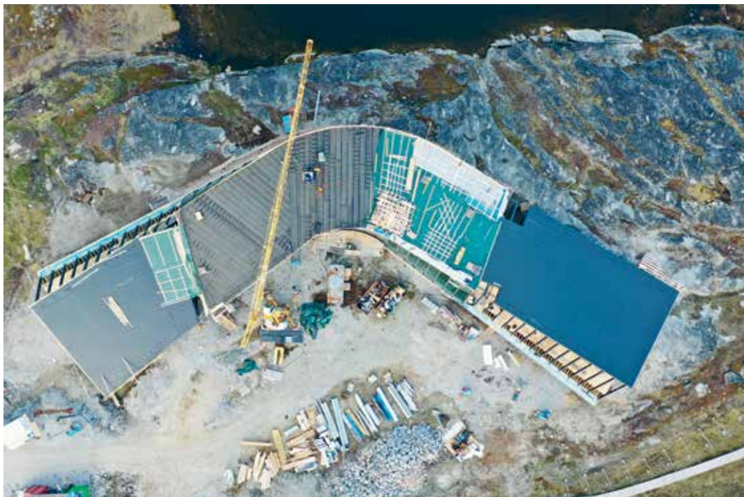
Kangiata Illorsua sangujoraartunik illu ilusiligaalluni, qulaaniik takullugu boomerangitut inissisimasoq.