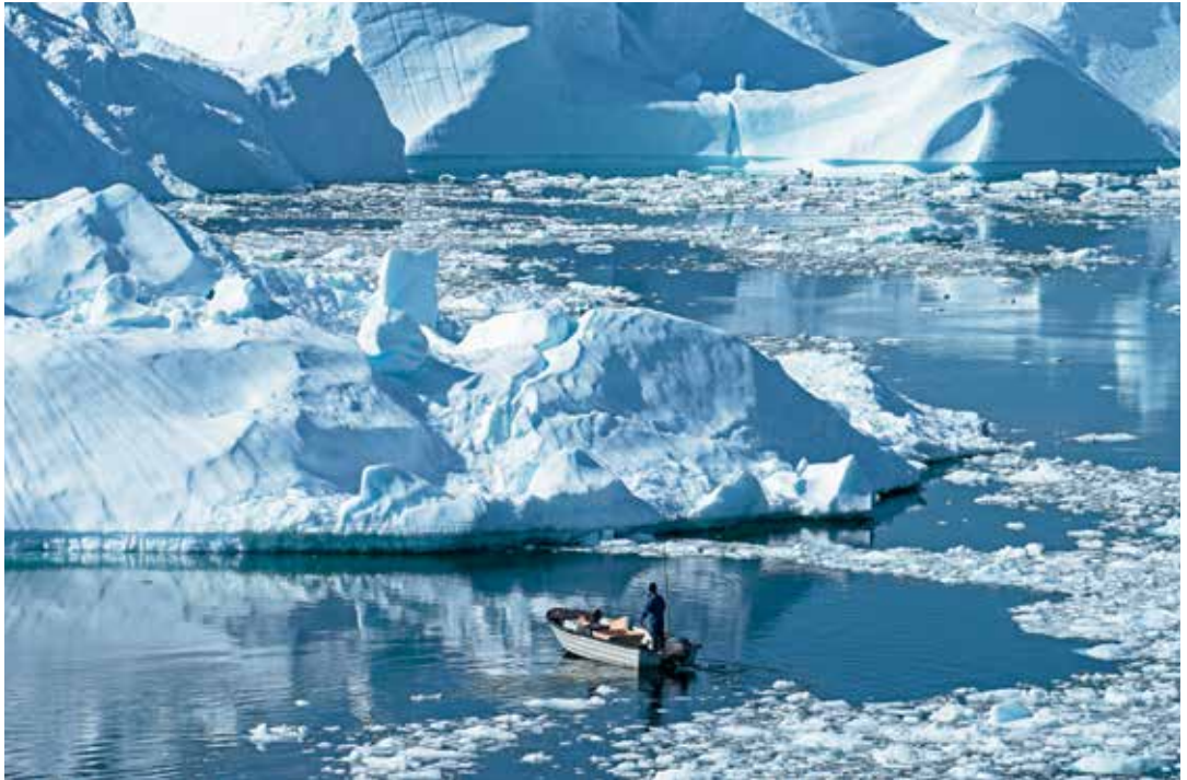
Kangiani umiatsiaarsorluni aalisartooq.

Aalisarneq aammalu aalisakkeriviit sulii Ilulisani inuussutissarsiutini pingaarnersaapput, aammalu umiarsualiviup eqqaa uummaarissumik suliaqarfylluni. Siusinnerusukkut pingaartumik imaani uumasunik miluumasunik pisaqartarnek, soorlu puisit arferillu, nerisassaqartitsisarsimavoq aningaasarsiorfusarsimallunilu. Taamanikkut piniarnermut pitsaasunik atugasqaqartitsinissaq qitiutinneqartarsimavoq, assersuutigalugu immikkuullarissunik ileqqoqarnikut. Ullumikkut qalerallit raajallu pisaqartarput, kisianni pisat nutaajugaluartut aalisarnermi piniarnermilu periaaserpassuit piujuartinneqarsimapput ineriartorteqqinneqarsimallutillu.