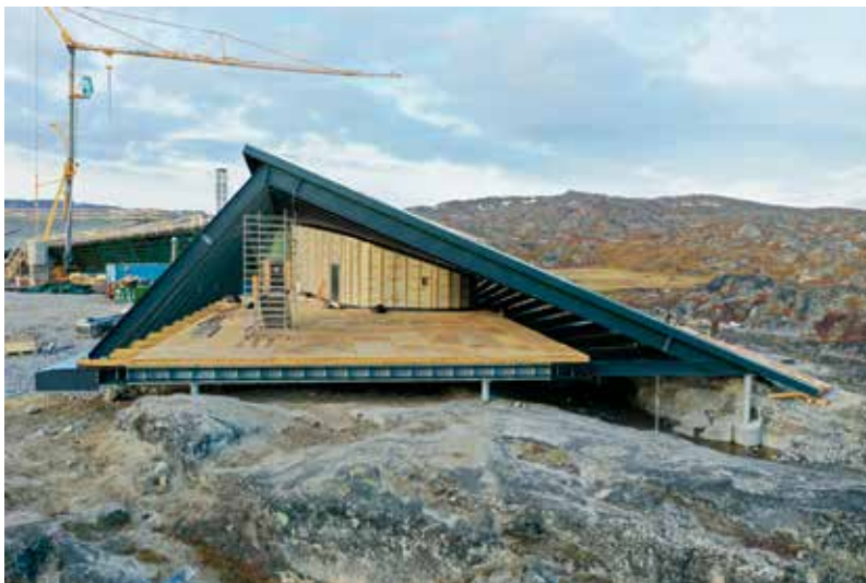
Kangiata Illorsua sananeqartoq.

Natii, qilaavi, salliarnartat silamiittut aammalu qaava kiisalu iluani qaavisa ilai qisunnik qalliusersugaapput. Qisuk atorneqarmerusooq Europami orpimmit manngersumeersuuvoq nungulajaatsoq aammalu issittumi silap pissusaani ninngujsooq. Qisuit sisammik sannaanut qajannaatsumut tapiliullugu kissalaartumik isikkoqartitsissapput, peqatigisaanillu pinngortitaq illorsuarmut avatangiisooq tikkuutissallugu.