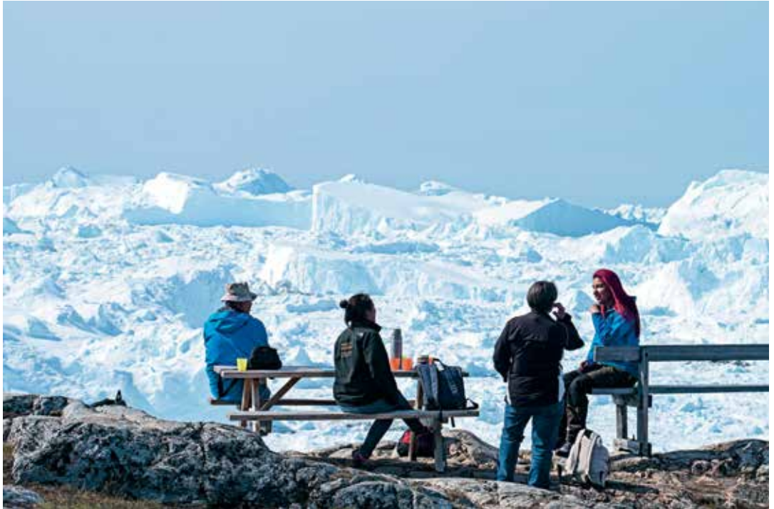
Kanganut isikkiveqarluni kaffisorluni unillatsiarneq.