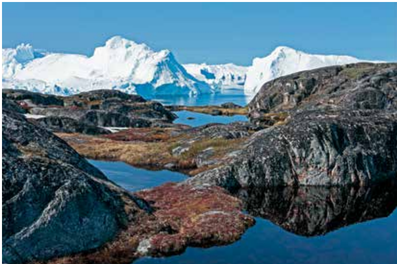
Ilulissat Kangiani pinngortitaq UNESCO-mit illersugaasoq.

Pisat aamma Qeqertarsuup Tunuani nunasiaataanerup aallartinnerani qitiutinneqarsimapput, tassani aalisartut pinngortitaq pissarsiaqarfiullu artartoq ornigartarsimallugu. Piniartut pikkorinneraat aamma taamaattarsimapput. Piniartut pikkorinneraat pisaqamanersaallu piniartorsuarnik taagorneqarput. Ilaquttatik kisiisa nerisitarisarsimanngilaat, kisianni allaat pisatik Europami nioqutissanik taarsertarsimallugit, taamaalillutik atugarissaarnertik takutittarsimallugu.