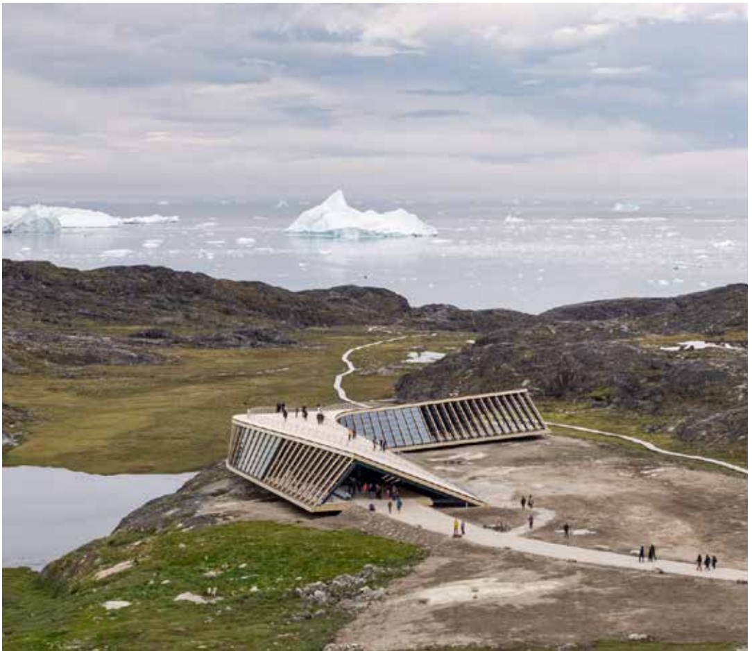
Kangiata Illorsuata qaavanut killilersugaanngitsumik qaqisoqarsinnaavoq, tassanngaaniit qaqqanut kangianullu isikkivigissaarluni.