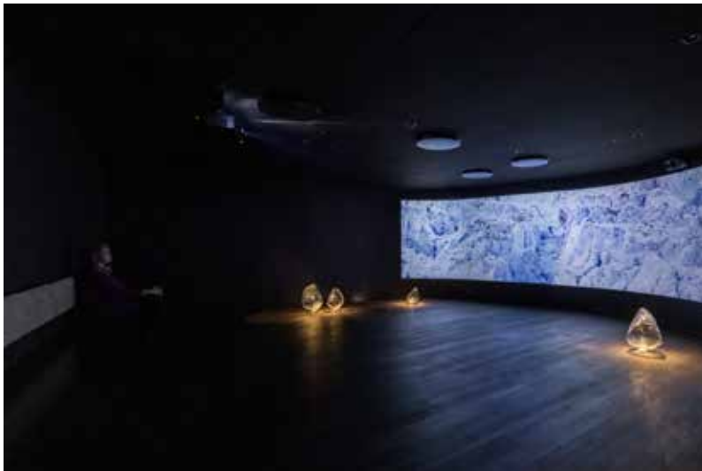
Kangiata Illorsua aamma filmertarfeqarpoq.

Takusaasut kusanartumik ilikkagaqarfusumillu misigisassaqtinnissaasa saniatigut Ilulissani Kangiata Illorsua piffissap ingerlanerani aamma sumiiffinni internettikkullu nunarsuaq tamakerlugu atuarfinit atuartunullu ilinniartitsivimmik neqerooruteqarsinnaassaaq. Taanna sermeq, silap pissusaa, pinngortitaq aamma inuit kulturiat pillugit saqqummersitsiviup imarisaasa Kalaallit Nunaanni nunarsuullu sinnerani meeqqat atuarfiini atuartunut siammartinnissaannut iluaqutaassaaq. Ilinniartitsivikkoortumik atuartitsisut illorsuup atuartitsinermut najoqqutassiai akeqanngitsumik atorsinnaassavaat, takusaanerup ilaatut imaluunniit atuarfimminni atuartitsinermi. Siunnerfigineqarpoq inuusuttut akornanni aallussititsinissaaq aammalu silap pissusaata allanngoriartorneranut sumiiffimmullu asseqanngitsumut pissutissaqartumik UNESCO-mi Nunarsuarmi kingornussassanut allattuiffimmiilersumut, paasisimasaqalersitsinissaaq.