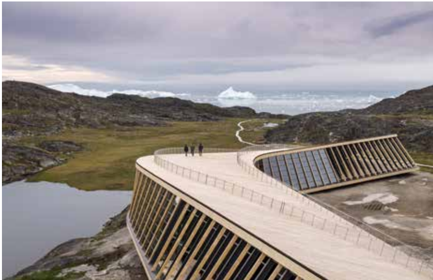
Takusaasut illorsuup qaavatiigoorsinnaapput aammalu pisinnaat aqputai atuataarlugit pinngortitamut ingerlaqqissinnaallutik.

Kangiata Illorsua naapittarfissatut eqqarsaa-taavoq. Tamanna illuliortaatsimi aamma taku-neqarsinnaavoq. Sannaa qipisuummat illup isui tamarmik qulisaapput, taamaalillutik takusaasut oqquisimaarsinnaallutik. Upernaap, aasap uki-allu ingerlaneranni qaavanukartoqarsinnaamat, najukkameersut allallu tikeraat illorsuaq piumaleraangamik ornissinnaavaat pissusissamisoortumik katersuuffigisinnaallugu, kangianut isikkivik alutornartooq aammalu ilularujus-suit kusanarluiinnarlutik silammut tissukartut misigisinnaallugit.